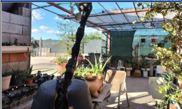
Imagen 1: Punto donde se toma la muestra