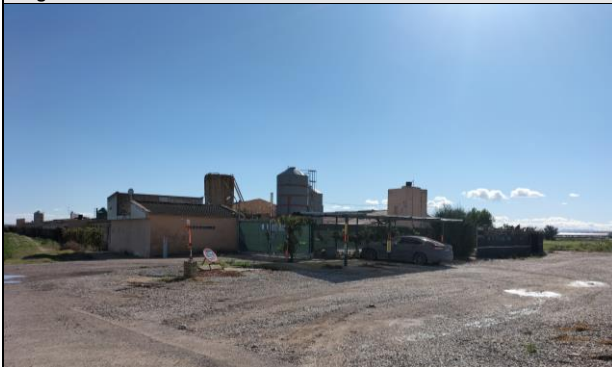
Imagen 3: Acceso