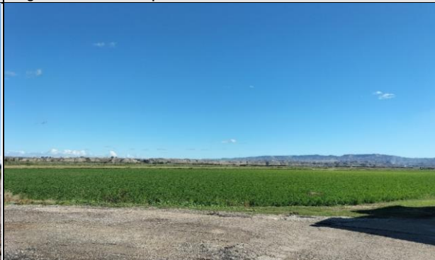
Imagen 4: Entorno